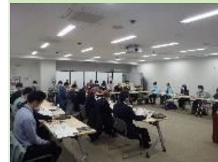
個別避難計画策定検討委員会