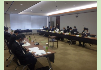
立地適正化計画策定委員会