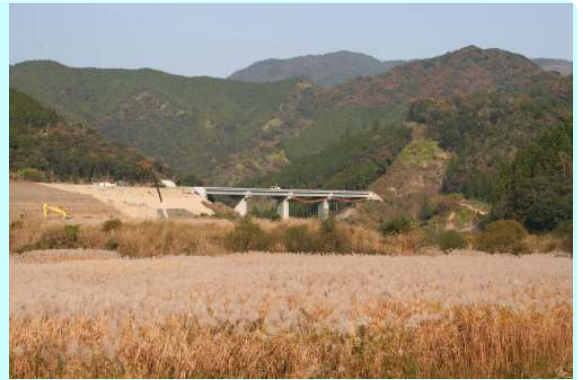
家田地区の湿原に広がるオギの穂と、建設中の東九州自動車道路（北川コース）