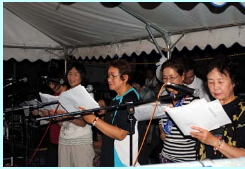
紙芝居を熱演する蒲江浦浦づくりの会の皆さん