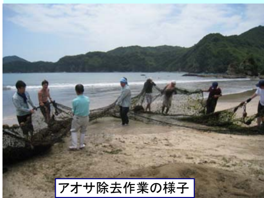
アオサ除去作業の様子