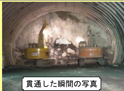
貫通した瞬間の写真

7月15日(金)、大分県と宮崎県の県境をまたぐ「陣が峰トンネル」が貫通しました。大分県側から大型ブレイカにより掘削し、宮崎県側と繋がる穴が中央付近にポッカリと開き、平成24年度開通予定である「蒲江IC～北浦IC間」の工事に弾みがつきました。