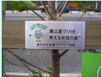
設置したネームプレート

3月10日、別大国道の6車線化を記念して、マイツリー植樹式が行われ、「蒲江道づくりを考える女性の会」の皆さんが参加しました。当日は、25組の皆さんがいろいろな思いでマイツリーを植樹されました。