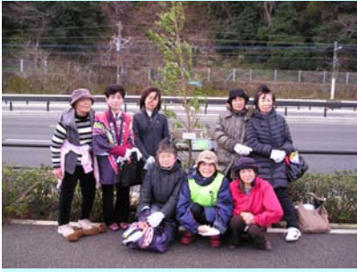
植樹したホルトノキと参加した皆さん