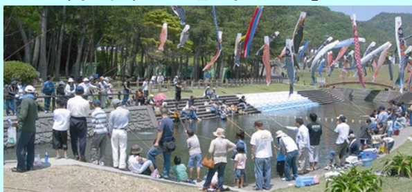
ニジマス釣り堀の様子