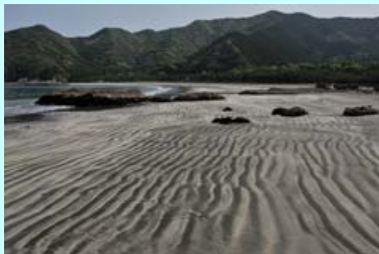
波当津海岸の砂紋

日豊海岸の春の風物誌に波当津海岸の砂紋があります。この季節、潮がひくとききれいな砂紋がよく見れます。3月20日、「春到来！蒲江でふわり癒し旅」波当津散策モニターツアーが開催されました。参加した人からは「波当津の大自然に癒された」、「地元の人との交流が楽しかった」などの声が聞かれ大満足のツアーと