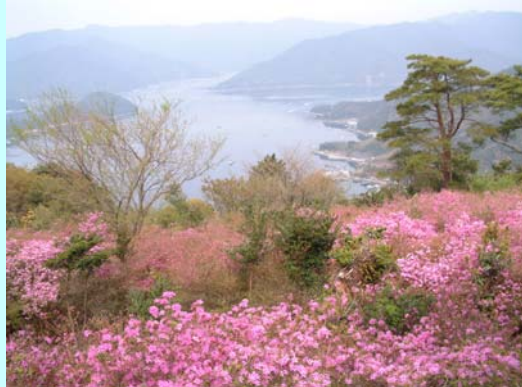
仙崎つつじ公園からの眺望

仙崎つつじ公園は、昭和55年から地区住民と行政が一体となって整備してきた公園で、今では多くの観光客が訪れるすばらしい公園となりました。公園には5万株の「フジツツジ」が自生しており、4月中旬から下旬にかけて、あたりはピンクのじゅうたんになります。現在は、地元の「仙崎つつじの会」の皆さん