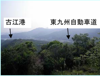
弘川展望台からの展望