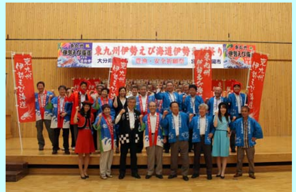
皆さんそろってエビ!エビ!オー!

◆問い合わせ先◆ (社)延岡観光協会 TEL:0982-29-2155 佐伯市観光案内所 TEL:0972-23-3400