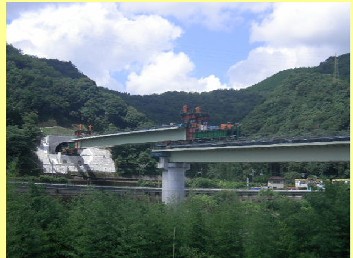
すさ大橋の工事状況

東九州自動車道(佐伯～北川間)の工事進捗状況写真が下記URLでご覧いただけます。