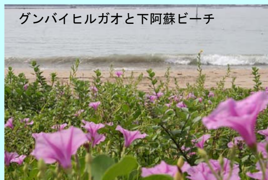
ゲンバイヒルガオと下阿蘇ビーチ