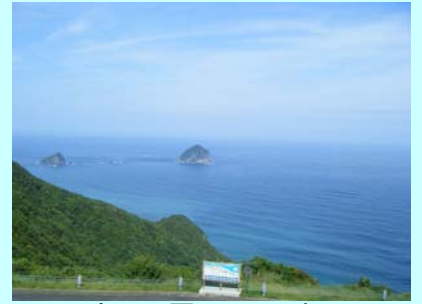
空の公園からの展望

標高は160m。眼下に日向灘を見渡すことができます。写真に写っている島は、左奥の島が「地黒島(じくろしま)」で右奥が「沖黒島(おきぐろしま)」です。青い海と青い空、目の前に広がる大海原が楽しめます。この場所は、釣りバカ日誌19のロケ地にもなりました。