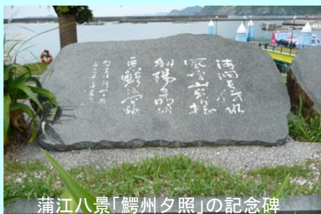
蒲江八景「鰐州夕照」の記念碑

大分県マリンカルチャーセンターの中庭にある蒲江八景の記念碑には「鰐州夕照【かくしゅうせきしょう】(深島)」の詩が刻まれています。この詩は、「嵐の日に見え隠れする深島が波間に躍るふかに見える」と意識されます。※鰐州は深島を示す。