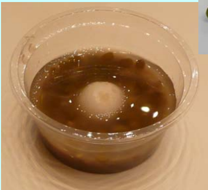
ぶんずうぜんざい