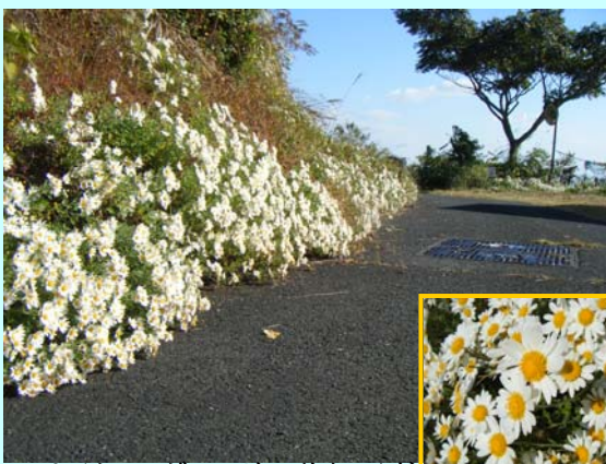
サイクリングロードに咲くのじぎく

今年は、大雨や害獣等の影響で少しまばらだという話でしたが綺麗にのじぎくが咲き誇っていました。昼飯祭りも復活し、蒲江の風物詩を大勢の方が楽しんでいました。