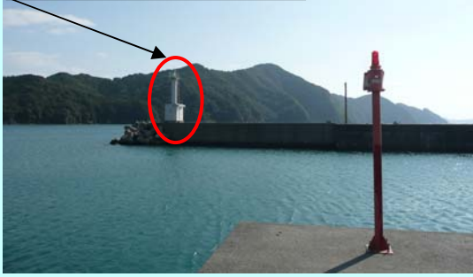
丸市尾港防波堤灯台(昼)

丸市尾の港の入口には『丸市尾港防波堤灯台』があります。この灯台は、宮崎県に一番近い大分県の防波堤灯台です。