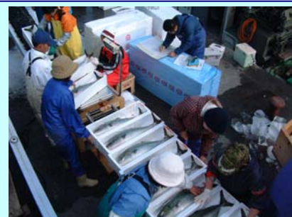
「寒ブリ」の出荷状況

佐伯市蒲江で養殖された「寒ブリ」は、脂がのった絶品の魚です。刺身や熱めし(あつめし)、照り焼き、ブリしゃぶなど美味しい食べ方も沢山あります。