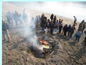
「とんど焼き」の様子