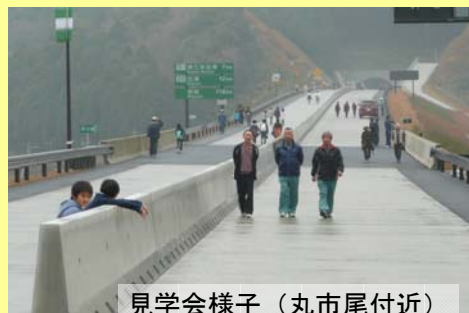
見学会様子(丸市尾付近)

12月15日、東九州道の施工業者さんの主催で日頃ご協力いただいている地域の方に現場内(蒲江IC～波当津IC間)を自由に散策していただく催しがありました。当日は、約200名の地元の方が参加され、「思ったより広い」、「早く運転してみたい」、「通院が楽になる」等、思い思いの感想が聞かれました。1日も早い開通目指して頑張ります。