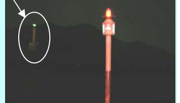
丸市尾港防波堤灯台(夜)