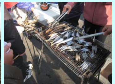
振る舞われる干物