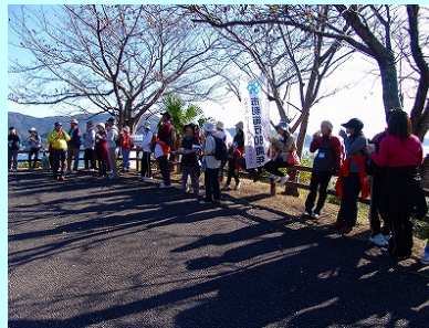
尻浦展望台で休憩している様子

11月18日(日)に、北浦町と島浦町において、市政施行80周年記念事業「延岡をめぐる4Dayマーチin北浦」が開催され、約100名の幅広い年齢層の参加者が、「お大師! 観音! 浦・浦めぐりうおーく!!」をテーマに、ウォーキングや島めぐりを楽しみました。