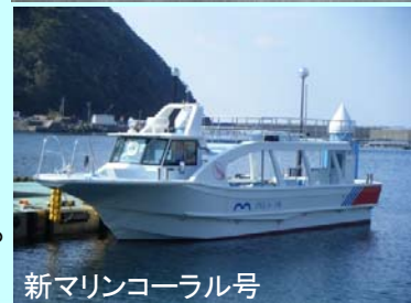
新マリンコーラル号

大分県マリンカルチャーセンターの遊覧船「マリンコーラル号」の2代目が新たに建造され3月30日に関係者を集めて就航式が行われました。4月1日から運行を始め、1日3回運行しています。(天候により運休)