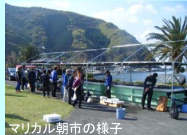
マリカル朝市の様子

第1回目が4月6日に開催され多くの出展者が地元で取れた新鮮な魚介類や加工品が販売されお客さんに喜ばれていました。