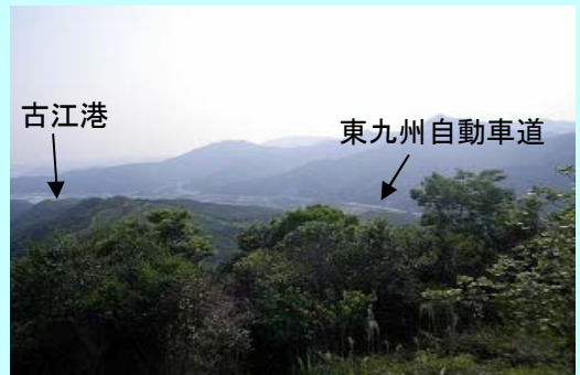
弘川展望台からの展望

さらに陣ヶ峰を登ると陣ヶ峰展望台があります。そちらでは蒲江・北浦が一望でき大分県側の東九州自動車道も見えます。車で行けますが道路が狭いので注意が必要です。