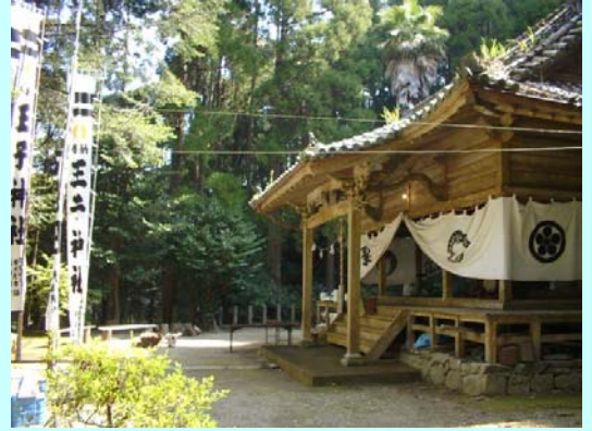
春祭りで飾られた王子神社

社手前には昭和十五年に建てられた”神楽設立記念碑”があり、4月6日(日曜日)には春祭りとしてのぼり旗や神社幕が飾られてた神社の中で神楽奉納が行われました。