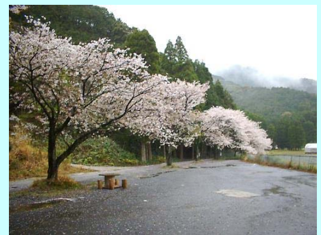
3月29日の波当津桜並木

県道から波当津海水浴場に向かう道路には桜がきれいに咲いていました。また、海水浴場駐車場の裏には桜並木があり、約20本の桜が水路沿いに並んで歩く人をいやしてくれます。駐車場の波当津周辺観光MAPの看板には観光スポットとして桜以外にもホテルやハマユウの情報が掲示されています。