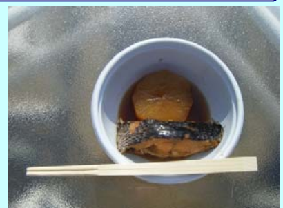
たかいよの煮付け

3月9日(日)に大分県マリンカルチャーセンターで開催された「東九州道開通1周年記念感謝祭」で「新鮮魚! たかいよ」や「たかいよ釣り」の案内文字。なにかよほど高級な魚かと思えば「メジナ」のことでした。大分県南では「たかいよ」、九州各地では「クロ」とも呼ばれるようです。この日は、大根との煮付けがワンコインで販売されており、煮汁の染みこんだ身は美味しかったです。