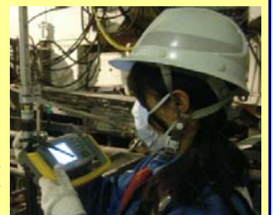
機材の設定を行う様子

東九州道（佐伯～蒲江）間にある佐伯トンネルの連続鉄筋コンクリート舗装現場（日本道路株）において、全国各地のスリップフォームの情報化施工を回られ、施工の指導をされている女性技術者がいます。話を伺うと、「これから女性がもっと活躍でき、長く働ける環境整備が行われることを願っております。」と話されました。女性技術者が少ない建設業界ですが、『みんなががんばれる現場環境』の思いは同じです。