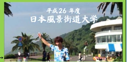
平成26年度 日本風景街道大学