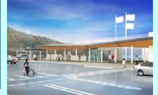
イメージパース(案内所等)