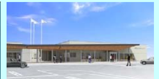
イメージパース(直売所等)