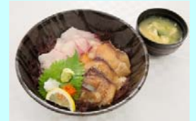
「へべすぶり丼」→