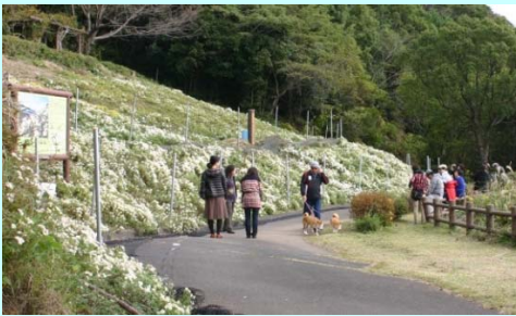
のじぎくを楽しむ人とワンちゃん

11月16日（日）に「第15回たかひら展望公園のじぎく祭り」が開催されました。地域の方々が植栽し、手入れを行った”のじぎく”の花は、今年は鹿等の被害も少なく、綺麗に咲き誇っていました。祭りでは、多くの催しや郷土料理がだされ、大勢の方が蒲江の秋の風物詩を楽しみました。