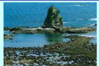
大間海岸の「さざれ石」

さざれ石は石灰石が長い年月の間に粘着力の強い乳状液に変化し、小石を凝結して巨石になったもので、下阿蘇ビーチ付近でも見ることができます。