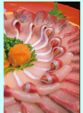
へべすブリのお刺身