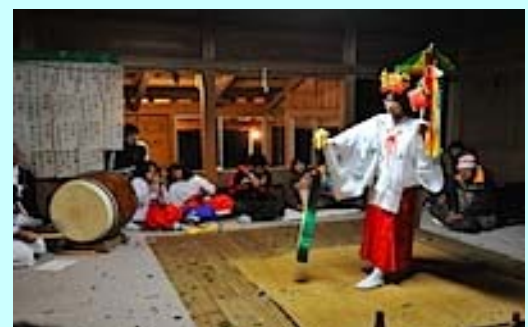
町指定無形民族文化財の「三川内神楽」

同じ北浦町でも海岸地区(古江、市振、宮の浦)の神楽と山間地区(三川内地区)の神楽では特徴が異なっています。