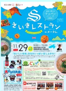
さいきレストランのチラシ