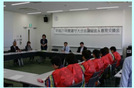
総会におそろいの衣装で参加

高齢化が問題となっているボランティアの会の皆さんと国際情報高校の生徒との共同作業で花壇に芝桜を植えました。「蒲江道づくりを考える女性の会」の方々も高校生と一緒に和気藹々と花植を楽しんでいました。