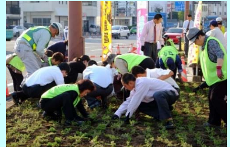
老若男女協力しての花壇整備