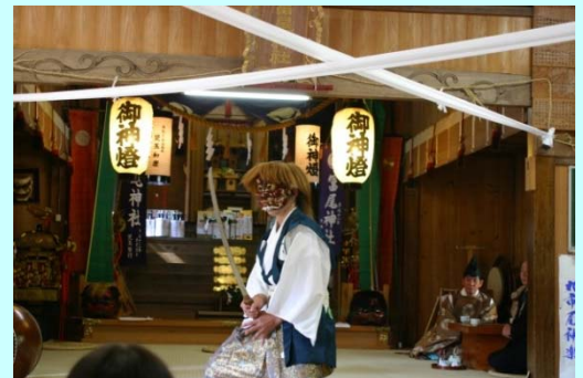
県指定無形民族文化財の「丸市尾神楽」

今年の「秋の大祭(霜月祭り)」は、11月21日(土)~22日(日)に開催されます。