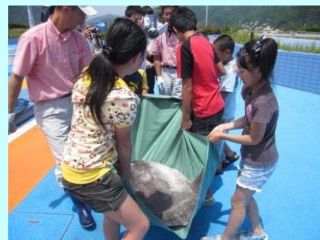
ヨッコラ、ドッコイショのマンボウさん

例年6月の上旬には海水温が上昇し、マンボウの生態にも好ましくないで「さよならマンボウ」のセミナーが開催されます。地元の河内小学校の児童たちがマンボウへ手紙を読んだり、マンボウを送る歌を歌ったりして多くの人に見送られながら帰っていきます。「マンボウさん、来年も戻ってきてね！」