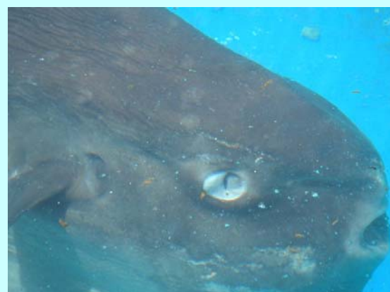
満足気味のマンボウさん