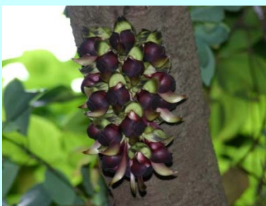
カマエカズラ (H26.5撮影)

カマエカズラは、熱帯域を中心に分布するマメ科のつる植物で、九州では蒲江だけに生育しており、大分県の天然記念物にも指定されています。5月頃花が咲き、その後、大きなさやの中に2cmほどの大きな実が10個ほどなります。