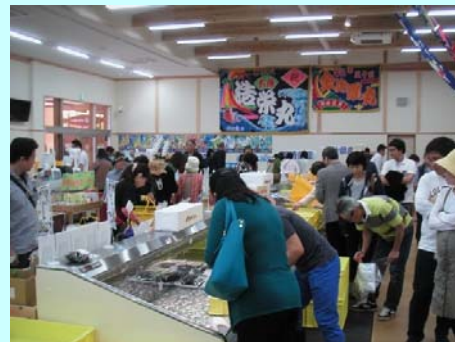
大盛況！きたうらら海市場

4月24日に宮崎と北九州が高速道路で繋がった日にオープンした北浦臨海パーク、ゴールデンウィーク中には大盛況でした。地元漁協が中心となって設立された「きたうら海友」運営の物販施設「きたうらら海市場」は、8時30分の開店と同時に高速道路を利用して福岡、北九州、大分方面から大勢の観光客で大にぎわい。延岡の新たな北の玄関口として、周辺観光地の拠点としてその役割が大きく期待されます。