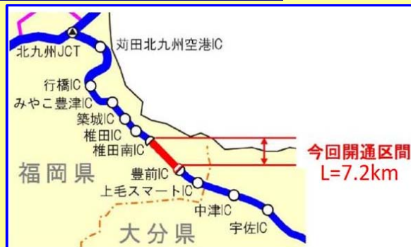
福岡県記者発表資料より

福岡、北九州、大分都市圏の連携軸が強化され、更に東九州域を中心に地域交流が活発になることが期待されます。