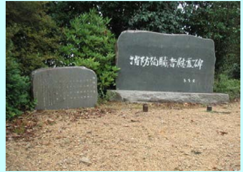
消防殉職者慰霊碑

絶景を楽しめる背平山ですが過去に大惨事がありました。山頂に設置されている消防殉職者慰霊碑がそれを伝えています。