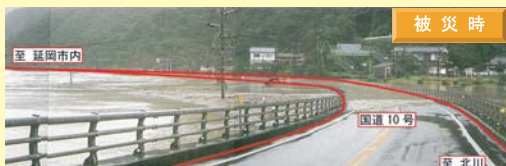
H9年 台風19号大水害路面冠水による全面通行止め