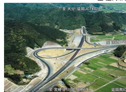
延岡JCT・IC 至熊本 至延岡市街 H20.12.17撮影