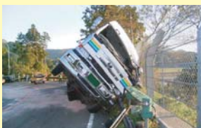
長井地区(国道10号)における事故写真