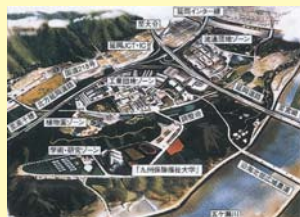
クエアパーク延岡完成予想図