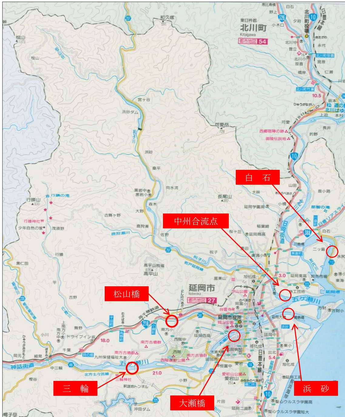
◎水質調査地点位置図