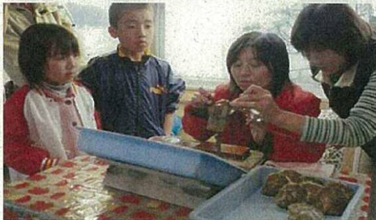
〈真珠アクセサリー作り体験〉