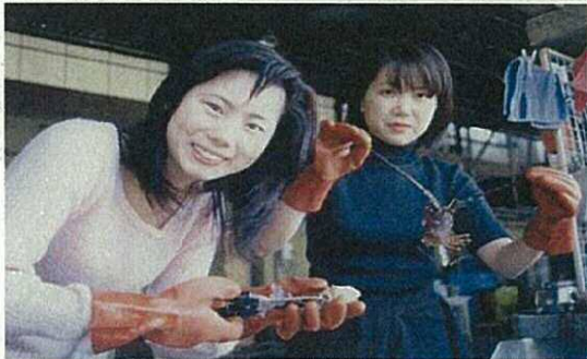
〈伊勢えびの捌き方教室〉