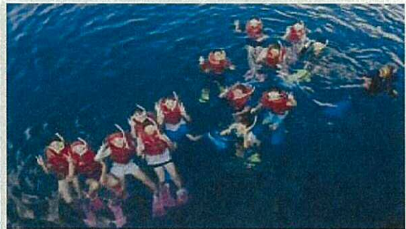
〈シュノーケリング体験〉