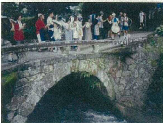
〈石橋上での郷土史の勉強風景〉