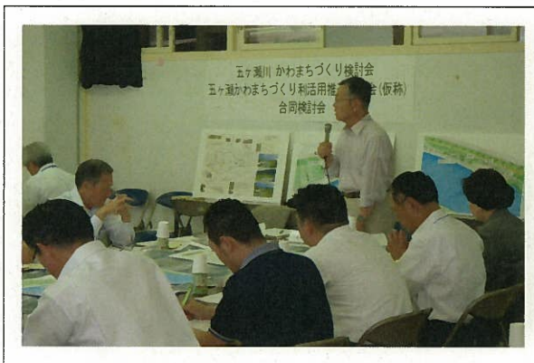
「五ヶ瀬川かわまちづくり検討会」の開催状況写真 (H. 25 5. 24)