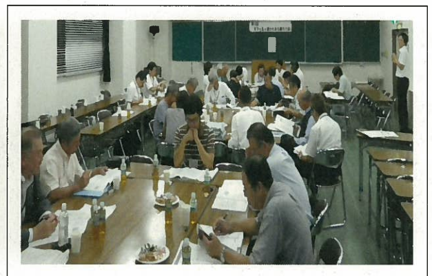
「天下一五ヶ瀬かわまち創ろう会」の開催状況写真 (H. 26 9. 24)