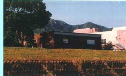
市民団体による活動拠点の整備事例（佐波川）

※ 河川管理者から河川管理施設の維持、除草等の委託を受けることも可能となります。委託先については、公募等の適正な手続きを経て選定を行う予定です。