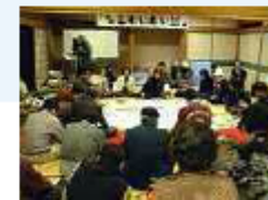
わいらい懇の開催による地域資源の発掘