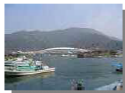
マリカルチャーセンター