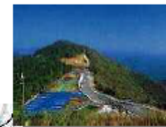
豊後くろじお温泉