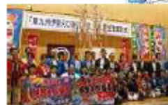
観光キャンペーンなどによる県境を越えた地域連携