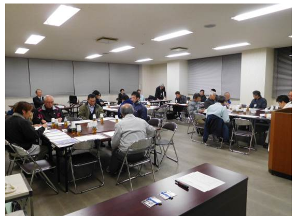
「天下一五ヶ瀬かわまち創ろう会」の 開催状況（平成 27. 12）