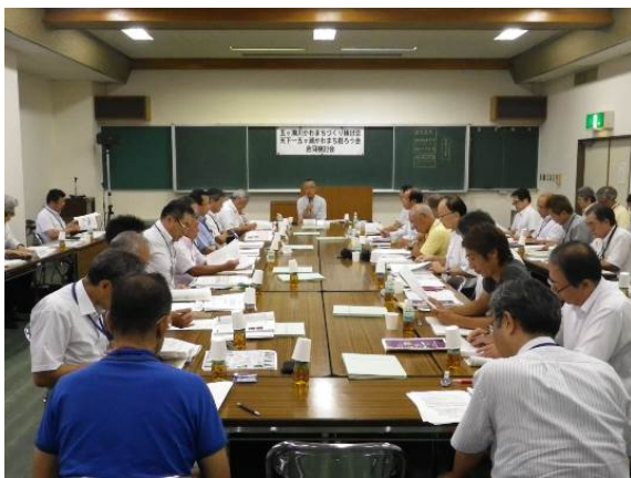
昨年の「かわまちづくり合同検討会」 開催状況（平成 27. 9）