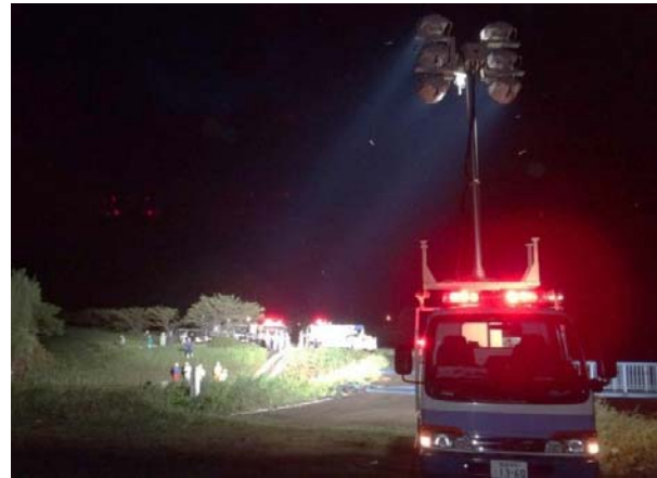
【災害現場での照明車の活動例】