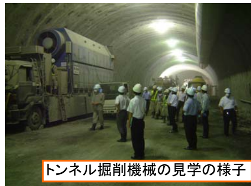
トンネル掘削機械の見学の様子