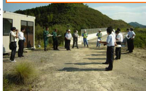
工事概要説明の様子(延岡JCT・IC)