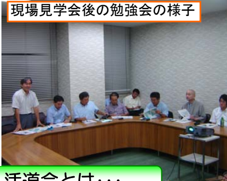
現場見学会後の勉強会の様子

見学会後の勉強会では、東九州自動車道や延岡道路の概要や進捗状況、整備後の効果等について勉強し、活発な意見交換が行われました。