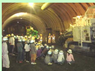
▲説明を聞く生徒さん

生徒さん達は掘削機械の説明を聞き、実際に掘削機械を動かしました。生徒さんは緊張しているようでしたがとても楽しそうでした。