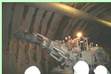
▲掘削機械を動かす生徒さん