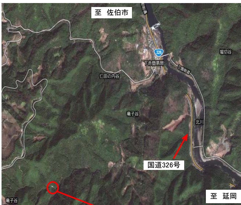
竜子谷の観音滝(竜子滝)

トレッキングの終了後には、地元の婦人部より「豚汁」や「恵方巻き」も振る舞われるそうです。みなさんも滝のマイナスイオンを浴びに北川町に足を運んでみませんか？