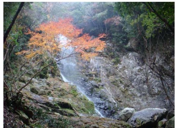
↑滝壺付近から見上げた竜子滝