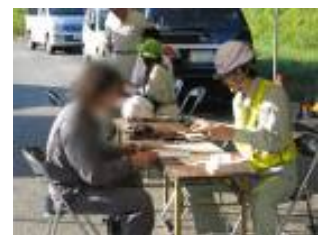
【通行許可書との照合】