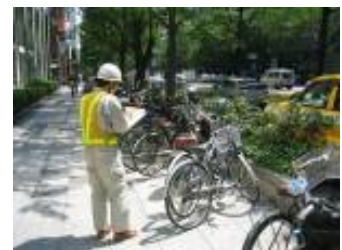
【放置自転車等の状況把握】

①道路の不正使用、不法占用等に係る指導取締り 道路区域内における未承認工事、不許可看板などの不法占用物件又は放置自転車等の状況把握、対象者への道路法等の関係法令の説明及びそれらの記録を行い報告する。