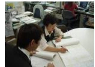
【申請書類の確認状況】

③道路法第47条の2に基づく特殊車両通行許可申請書に 係る受付、特殊車両通行許可申請書の通行経路・通行車 両等の確認及び許可条件付与等の審査、電算機への入 力、書類の作成・整理等を行い報告する。