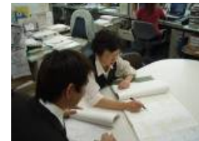
【申請書類の確認状況】

③道路法第47条の2に基づく特殊車両通行許可申請書に係る受付、特殊車両通行許可申請書の通行経路・通行車両等の確認及び許可条件付与等の審査、電算機への入力、書類の作成・整理等を行い報告する。