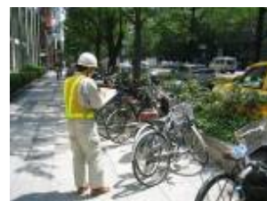
【放置自転車等の状況把握】

①道路の不正使用、不法占用等に係る指導取締り 道路区域内における未承認工事、不許可看板などの不法占用物件又は放置自転車等の状況把握、対象者への道路法等の関係法令の説明及びそれらの記録を行い報告する。