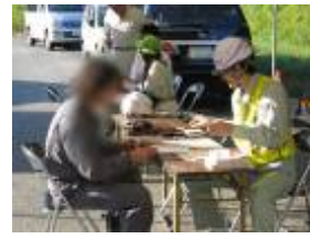
【通行許可証との照合】