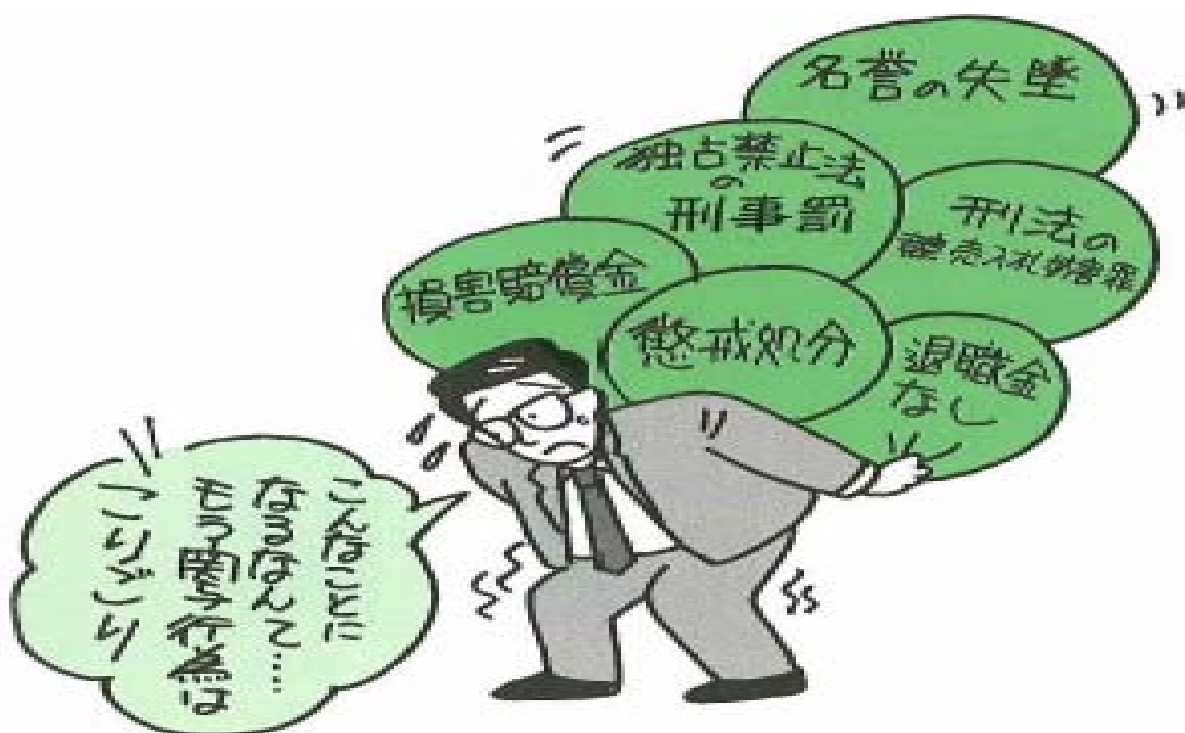
退職金なしは、懲戒免職の場合です。

以上、本マニュアルは、発注者綱紀保持規程の運用をわかりやすく説明しています。本マニュアルを読み、これを活用し、下記のイラストにあるような事態に陥らないよう心がけましょう。