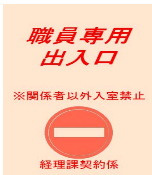
掲 示 例 2