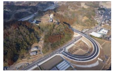
開通した朝地IC付近の航空写真