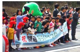
一生懸命お見送りしてくれた子ども達。色んな車が見られて楽しかったかな？