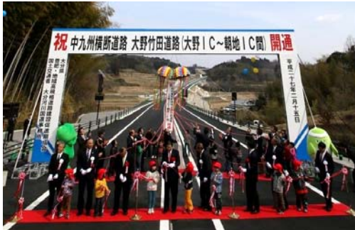
春に新一年生になる保育園児と小学校一、二年生に参加してもらい、テープカットとくす玉引き。300個の風船も飛ばしました。