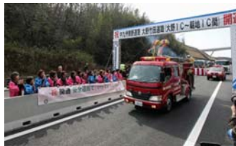
パレード車両出発！はっぴを着た女性の会が消防車をお見送り。