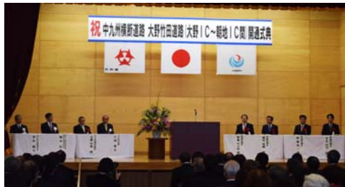
朝地小中学校での開通式典のようす