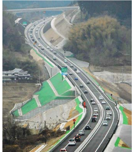
15時の開通後の写真。地域の活性化につながることを期待されます。