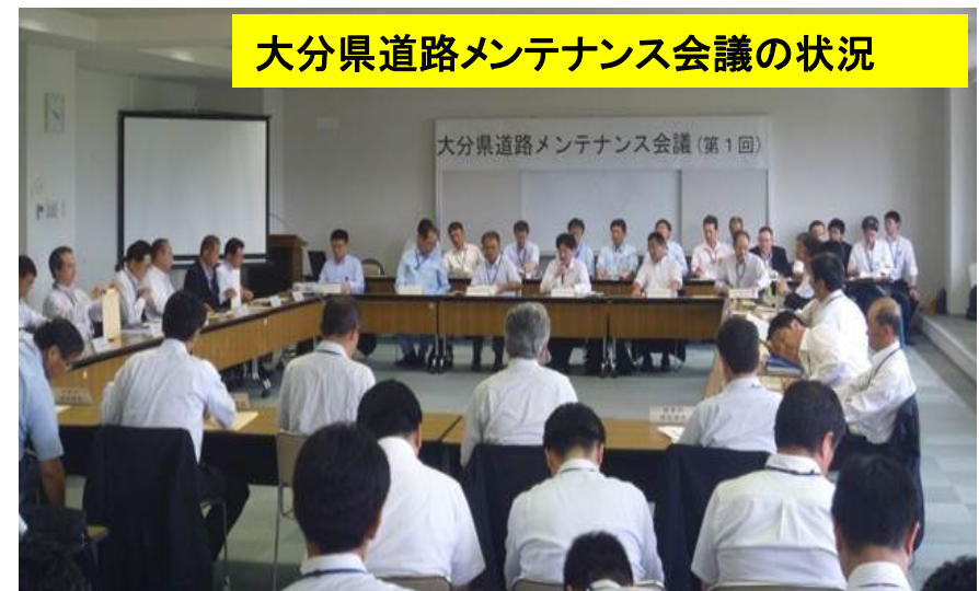
大分県道路メンテナンス会議の状況