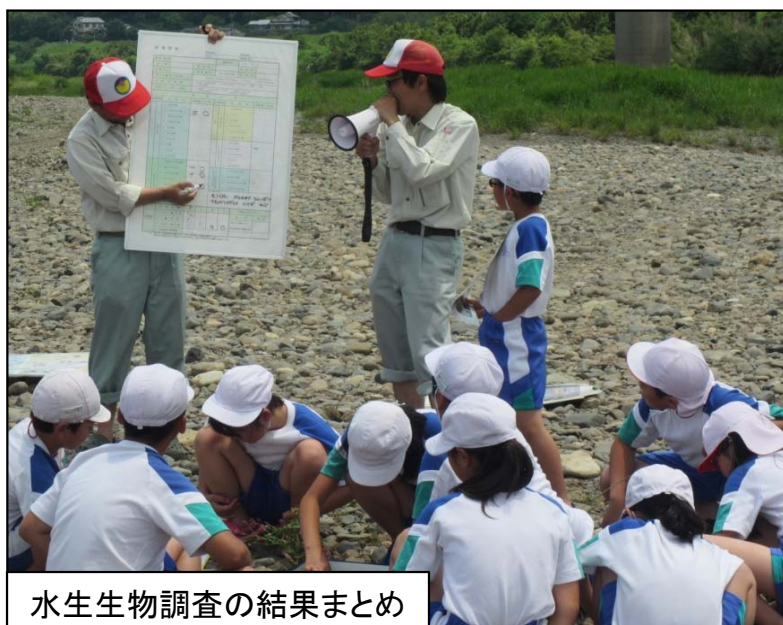
水生生物調査の結果まとめ