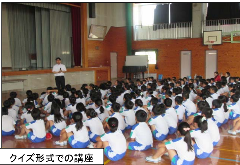
クイズ形式での講座