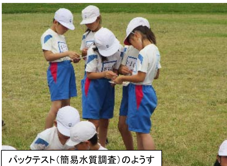
パケットテスト(簡易水質調査)のようす