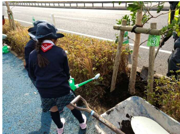
別大マイツリー会員の仲間たち！（128団体・約500名）