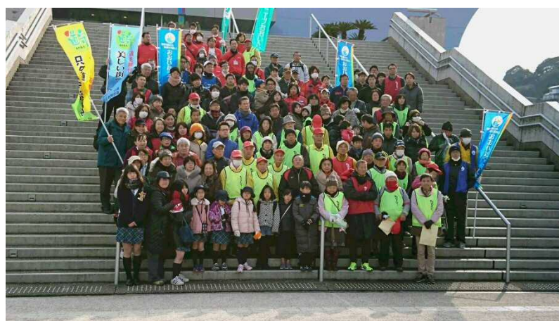
別大国道清掃の様子