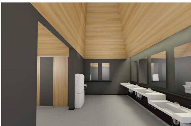
女子トイレ手洗いスペース