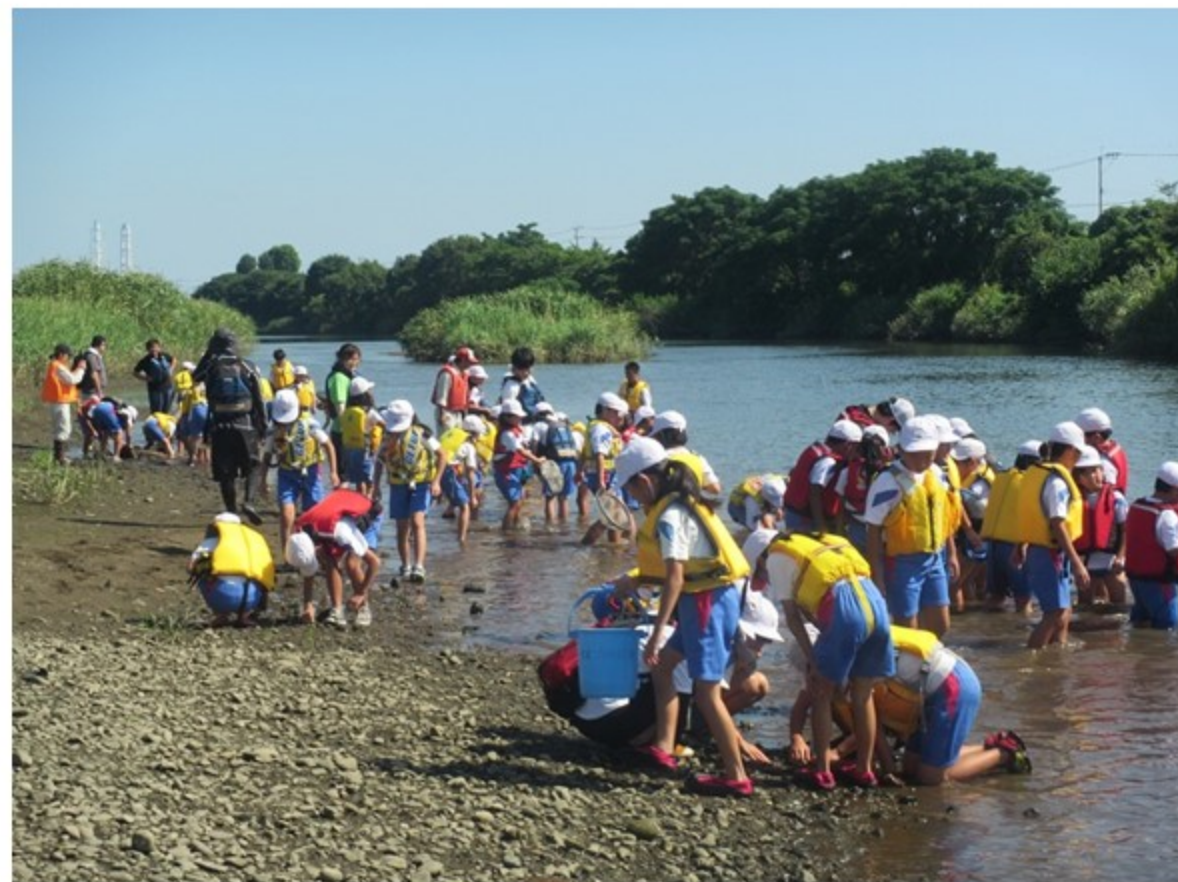
水生生物調査の様子