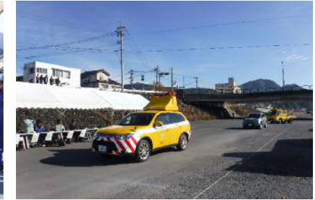
雪寒対応に向け出発