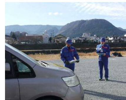
放置車両 所有者確認呼びかけ