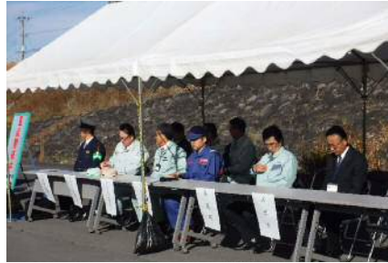
ご来賓のみなさま