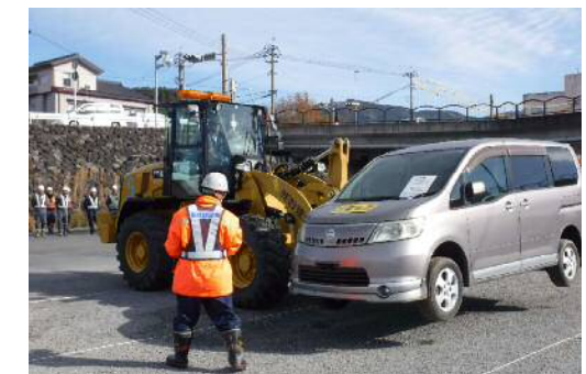
放置車両持上げ移動