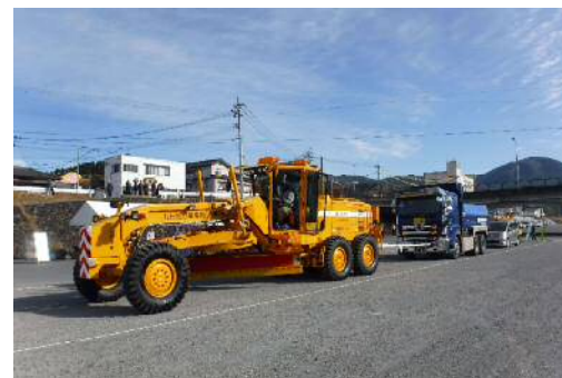
大型車両をけん引移動