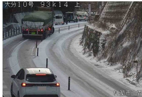
▲車両スタック発生状況 (R5. 1. 24~25 国道10号 立石峠)