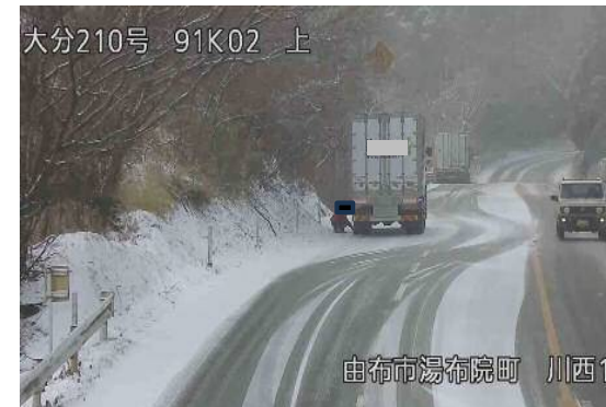
▲車両スタック発生状況 (R5. 1. 24~25 国道210号 水分峠)