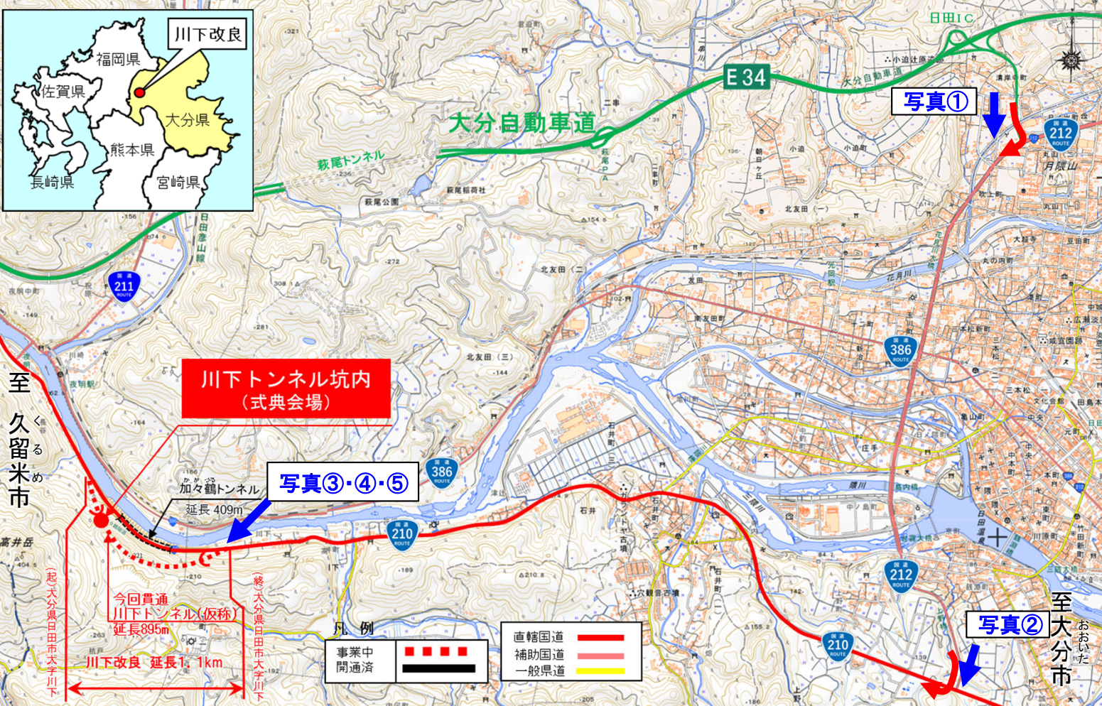
写真① 日田IC出口 日田インター入り口交差点