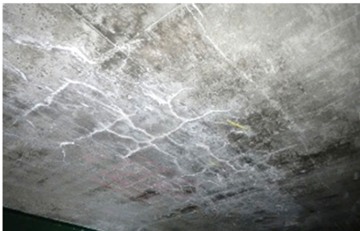
▲写真① 床版の二方向ひびわれ