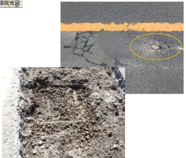
▲写真② 舗装のポットホールや床版の土砂化