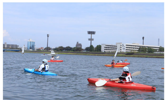
大人も子どもも盛り上がるカヌー体験 (大分市スポーツフェスタ 令和3年9月26日)