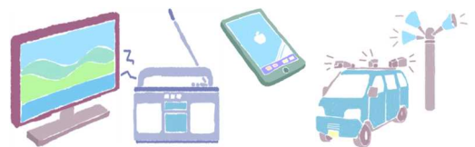
テレビ、ラジオ、けい帯電話、 防災無線・広報車から情報を入手する