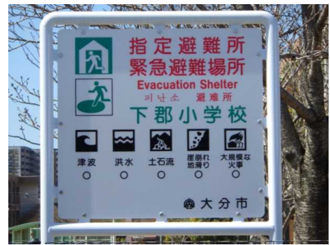
ひなん所の案内板 災害のときにひなんする場所