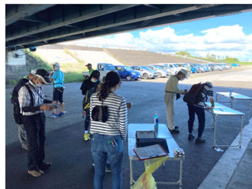
アンケートで大分川へのニーズ等を把握