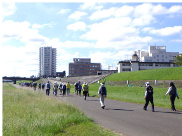
高水敷をウォーキング