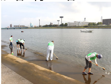
安全のためカキ殻等を除去