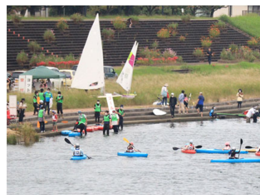
参加者が多くカヌーもヨットもフル回転