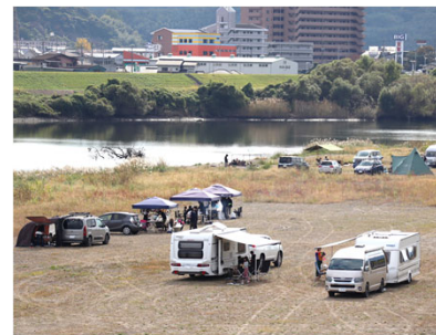
多くのテントが立ち並んだキャンプスペース