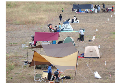
フリーキャンプサイト