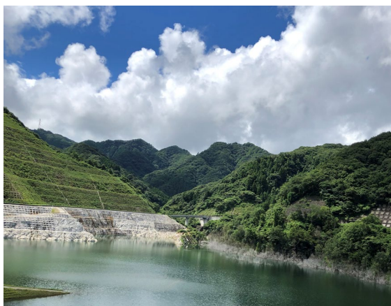
バス内から見るダムの景色は最高！