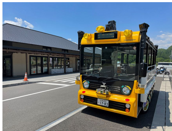
道の駅のつはる待機中のグリスロ 空席があれば道の駅のつはるからの乗車も可能

グリスロの詳細情報は大分市のホームページから！ https://www.city.oita.oita.jp/o256/notsuharu_gsm.html