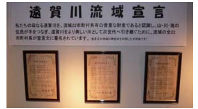
間伐材シートを使用した流域宣言書