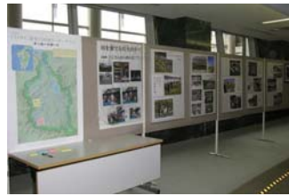
活動状況の紹介パネルなどを展示

会場となったイヅカコスモスコモンには、流域で活動する住民団体や関係者など約500人が参加して熱心に聞き入り、好評のうちに閉会しました。