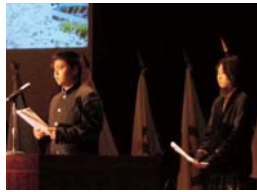
「源流の竹林を整備し竹炭を作り、河川浄化に活用する取り組み」 福岡県立嘉穂総合高校 大隈城山校 生徒代表