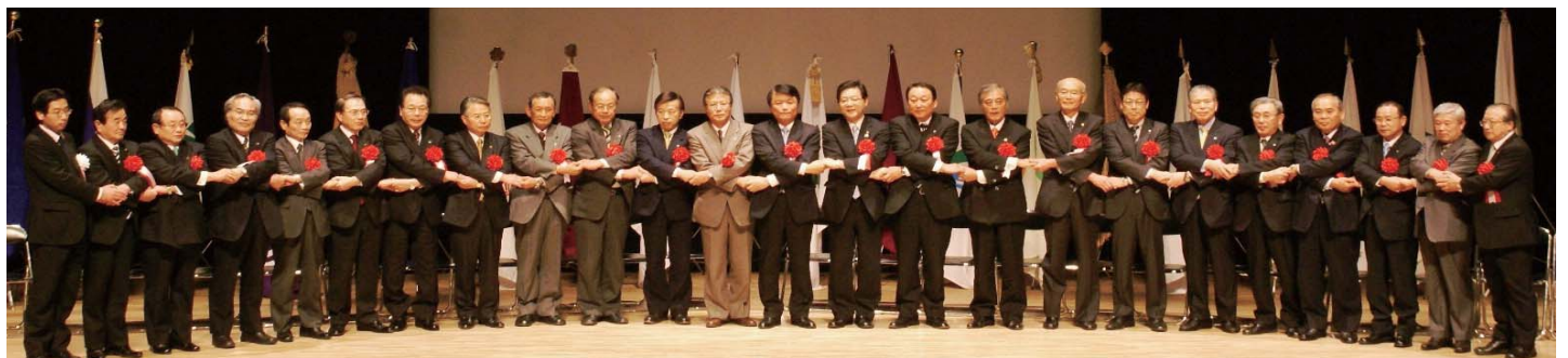
遠賀川流域宣言後、連携に向けて互いに手を取り合う遠賀川流域22の首長たちと、福岡県知事(中央)、遠賀川河川事務所長(左端)