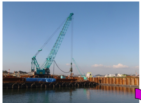
鉄の板で、水を止めます。