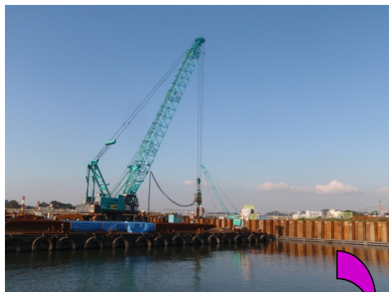
鉄の板で、水を止めます。