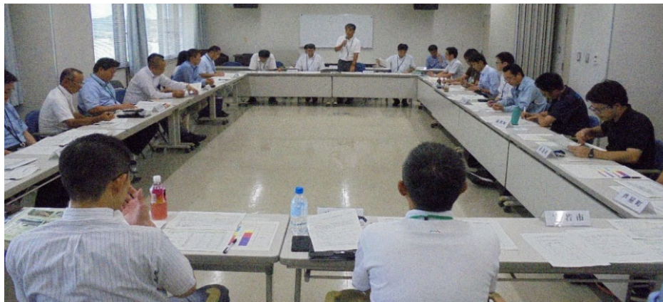
第1回排水機場の運転調整検討部会(令和元年7月31日)