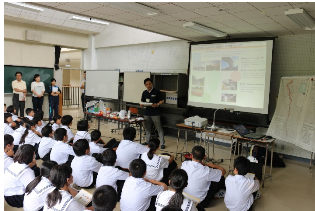
平成29年6月23日 添田中学校 出前講座風景