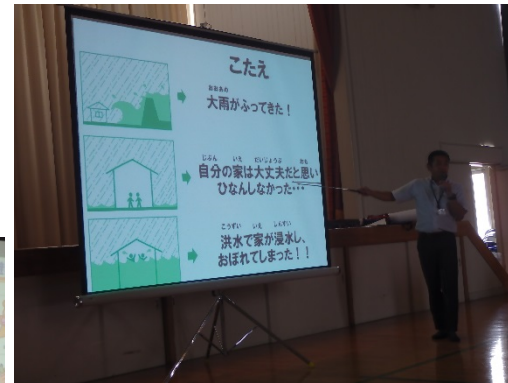
平成30年6月16日 宮若市講演会風景 (約250人)