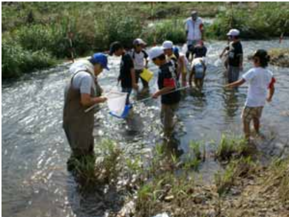
中元寺川 糸田橋 糸田小学校