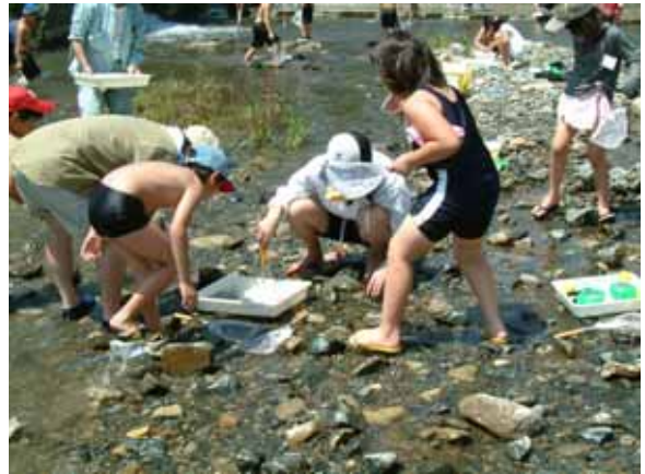
山口川 四郎丸 上穂波小学校