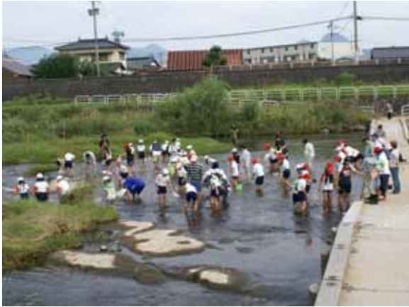
彦山川 番田橋 伊田小学校