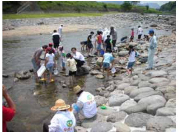
彦山川 歓遊舎ひこさん前 (社)飯塚青年会議所