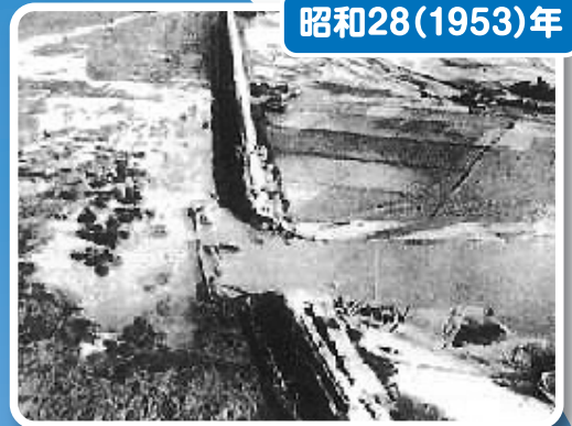
破堤氾濫による浸水状況(直方市)