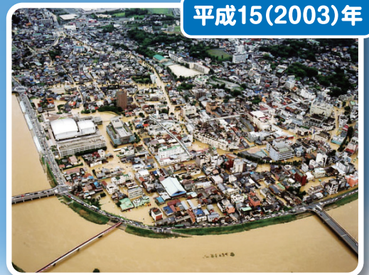
市街地の浸水状況(飯塚市)