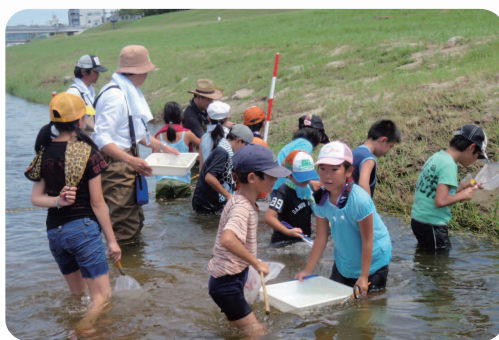
《川で》いきもの調べ