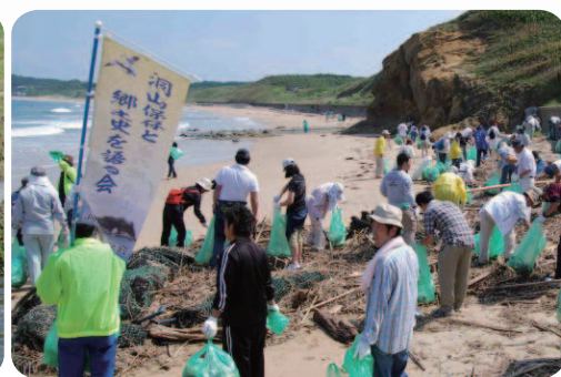
《海で》クリーンキャンペーン

主催 NPO法人遠賀川流域住民の会 国土交通省遠賀川河川事務所 後援 福岡県 遠賀川流域の22自治体 遠賀川水系水道事業者連絡協議会 遠賀川水系水質汚濁防止連絡協議会 問合せ先 国土交通省遠賀川河川事務所 河川環境課 ☎0949-22-1830(代)