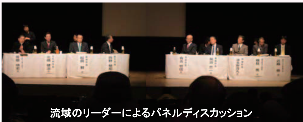
流域のリーダーによるパネルディスカッション