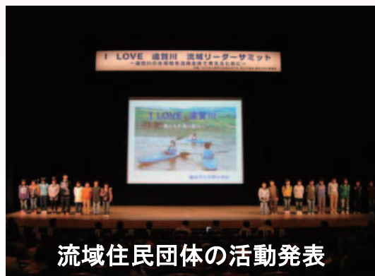
流域住民団体の活動発表