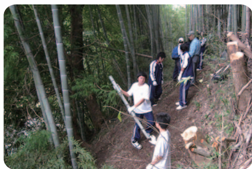
《山で》源流の森の再生