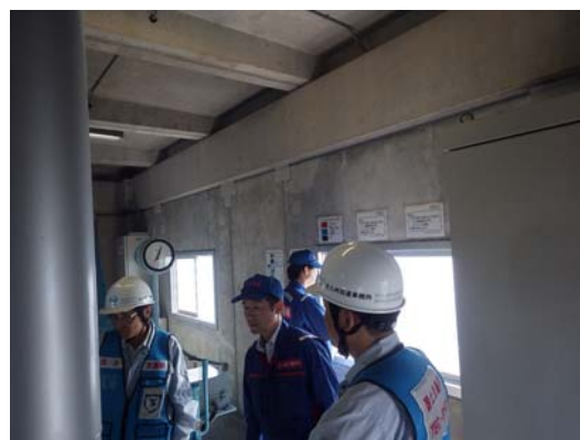
ゲート操作室における訓練の状況