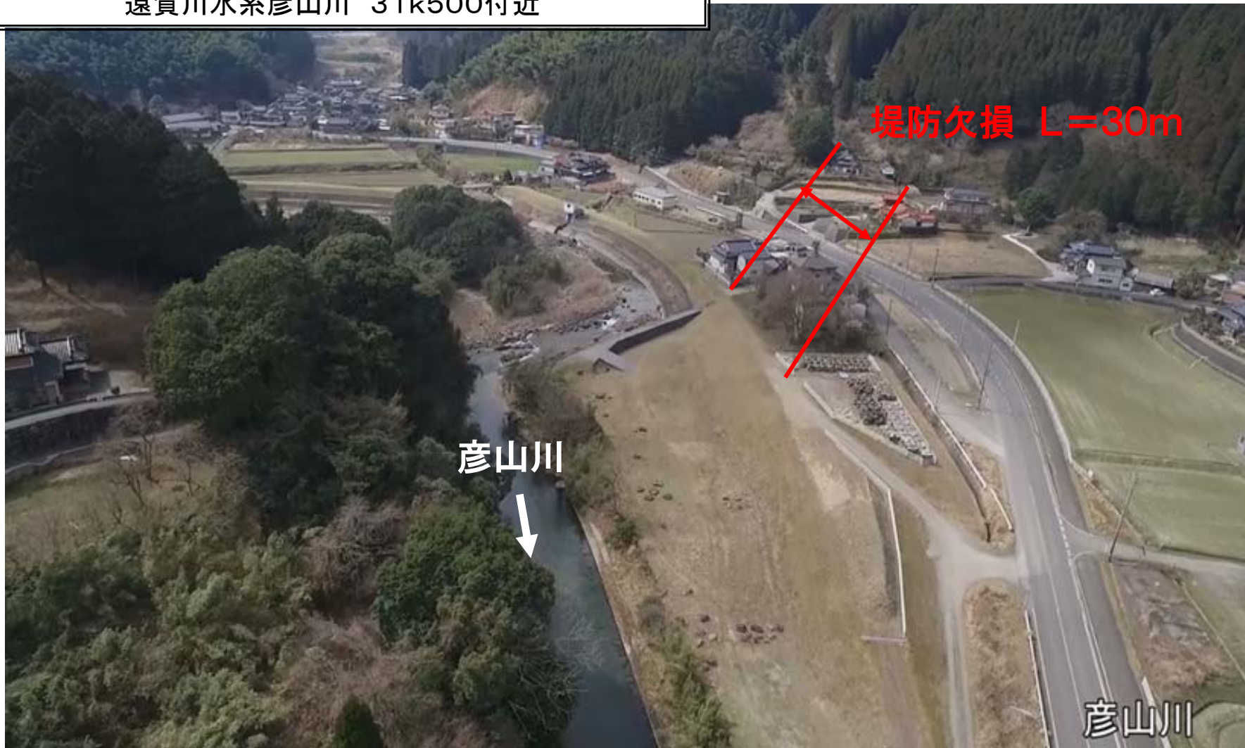
遠賀川水系彦山川 31k500付近

ふくおかけん たがわぐん そえだまち やくし ちさき 福岡県田川郡添田町薬師地先 おんががわすいけいひこさんがわ 遠賀川水系彦山川(左岸) 31k500付近