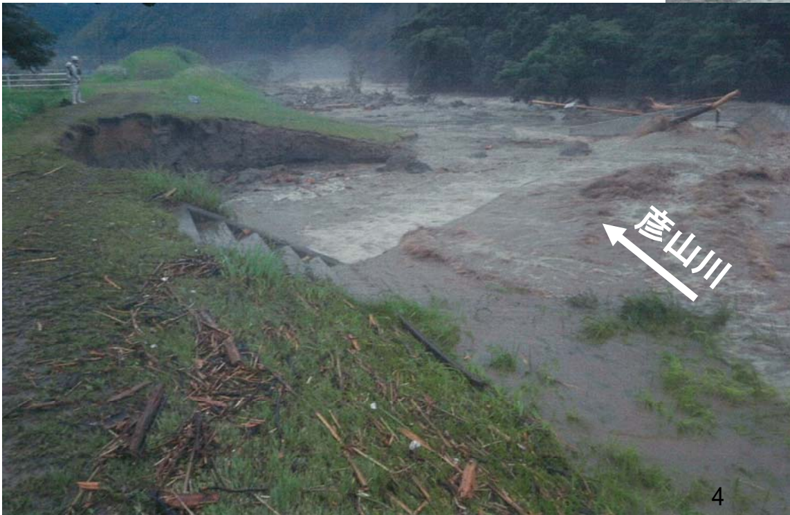
遠賀川水系彦山川 31k500付近

ふくおかけん たがわぐん そえだまち やくし ちさき 福岡県田川郡添田町薬師地先 おんががわすいけいひこさんがわ 遠賀川水系彦山川(左岸) 31k500付近