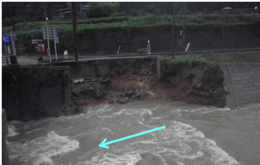
添田町 落合 上落合 彦山川34/100左岸 ＜ 建物流失状況 ：7月6日05時50分頃＞