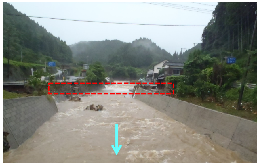
添田町 落合 上落合 彦山川34/100 ＜ 橋梁流失状況 ：7月6日06時30分頃＞