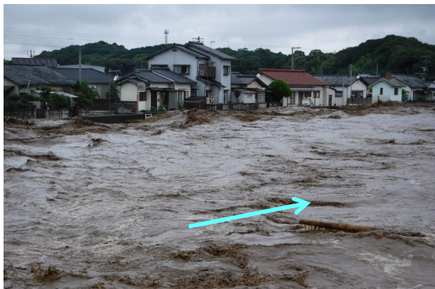
添田町 庄(庄中) 彦山川24/600左岸 ＜出水状況：7月5日17時40分頃＞