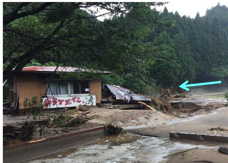
添田町 落合(下田) 彦山川31/000左岸 ＜家屋損壊状況：7月6日10時30分頃＞