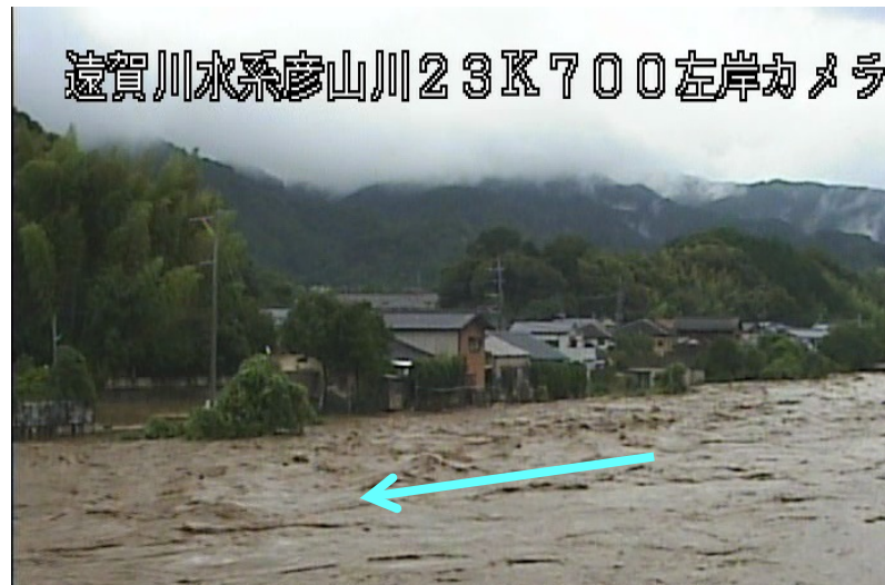
添田町 庄(岩瀬) 彦山川23/850右岸 ＜出水状況：7月5日17時40分頃＞