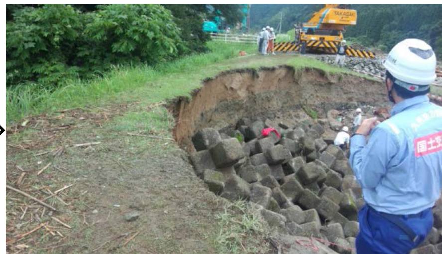
添田町 落合(薬師) 彦山川31/500左岸 ＜ 応急復旧状況 ：7月6日17時00分頃＞