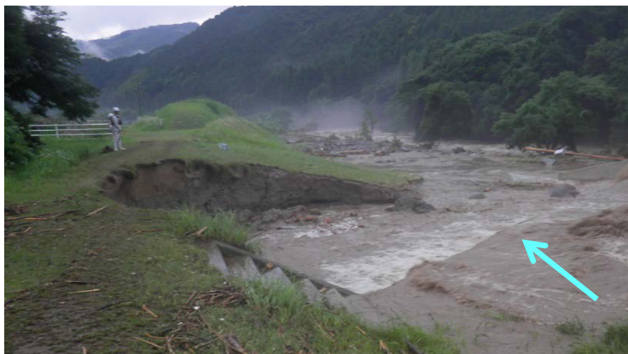
添田町 落合(薬師) 彦山川31/500左岸 ＜ 堤防欠損状況 ：7月5日18時40分頃＞