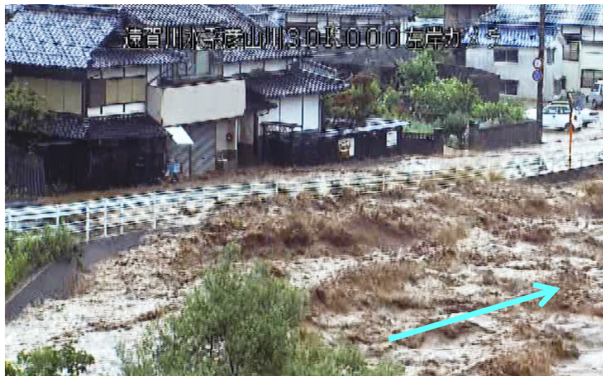
添田町 柘田(本村) 彦山川30/000左岸 ＜出水状況：7月5日17時10分頃＞